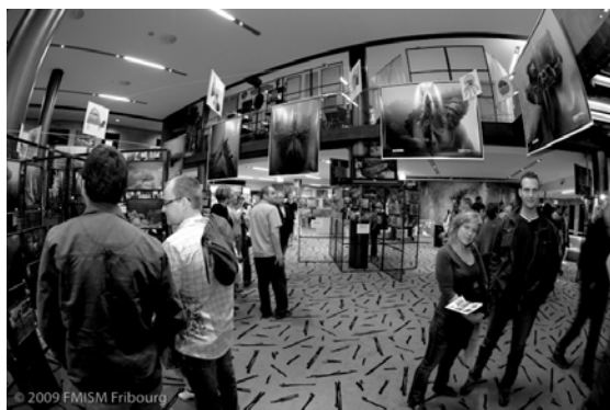
Petite tension avant la cérémonie de remise des prix