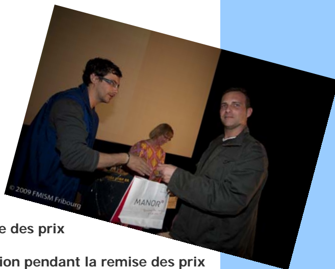
et une autre tension pendant la remise des prix