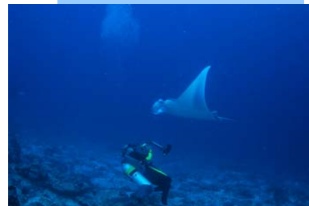
Le pro, au boulot !!!