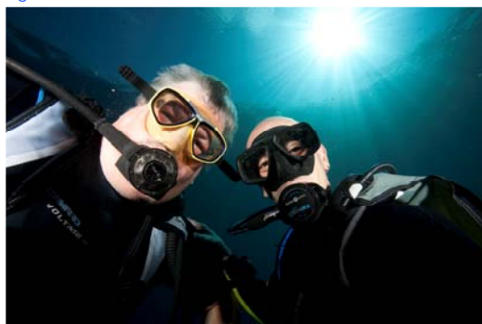
Pause au palier